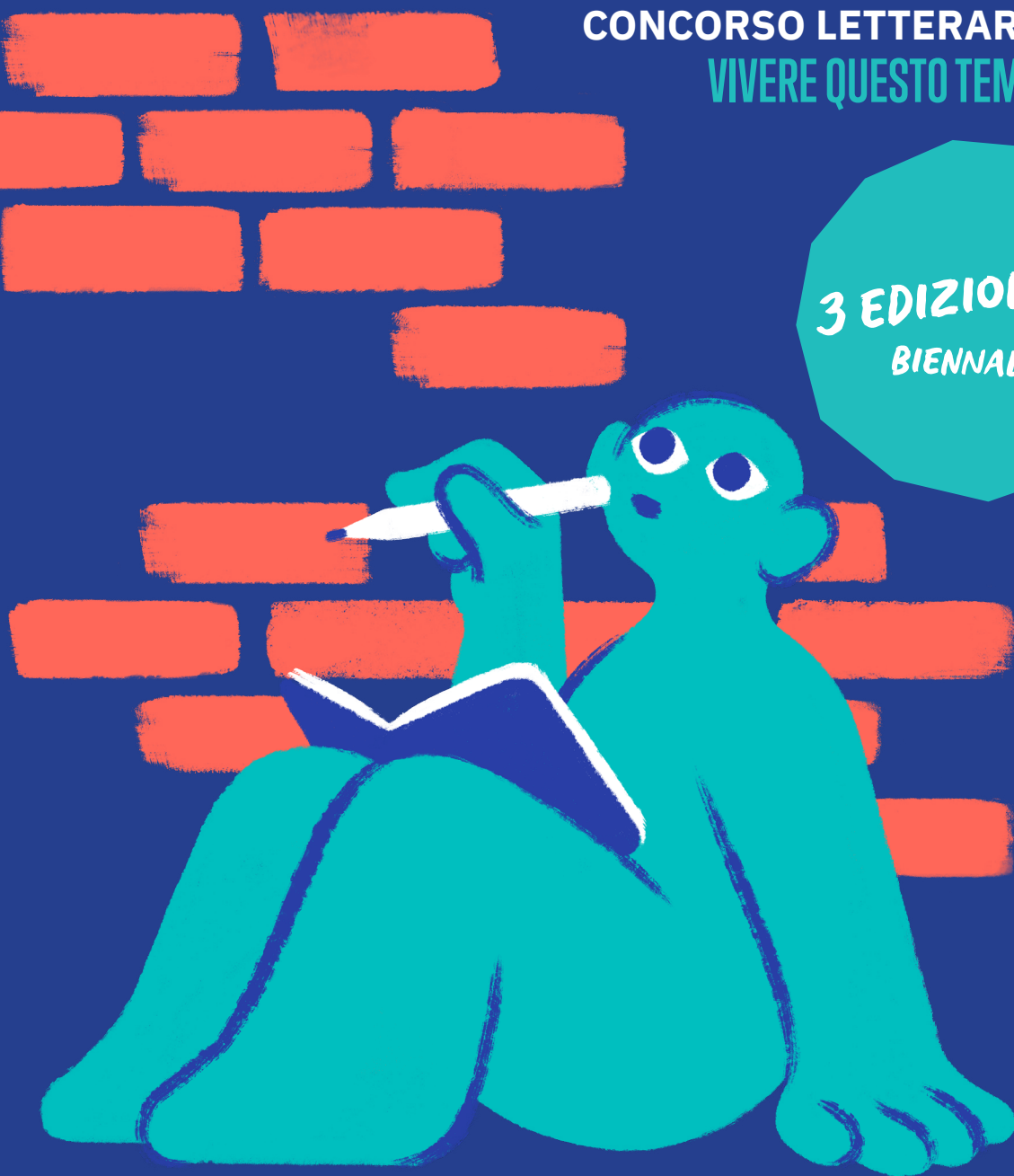
Illustrazione di Davide Saraceno